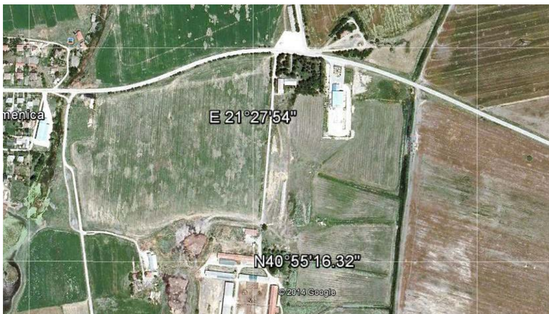
Локациска поставеност на Мак Минерал