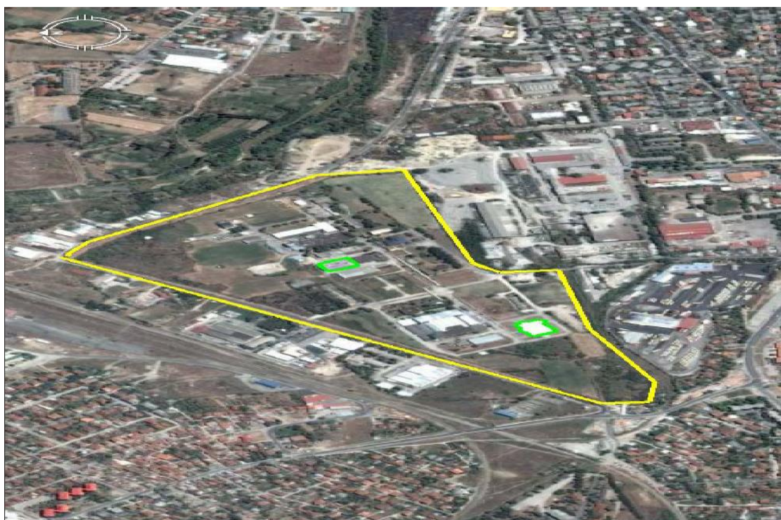
Слика 1. Мапа на локацијата со географска положба и назначени граници на инсталацијата.

1.1.3 Инсталацијата ќе работи, ќе се контролира, одржува и емисиите ќе бидат такви како што е наведено во оваа Дозвола. Сите програми кои треба да се извршат според условите во оваа Дозвола стануваат дел од Дозволата.