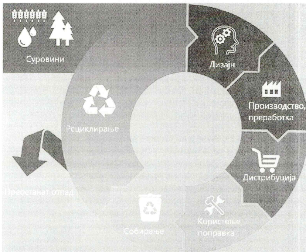
Слика 1.: Дијаграм на циркуларна економија

Друг поим кој е поврзан со циркуларната економија е „нула отпад“, кој е истовремено прагматичен и визионерски во својот пристап, додека материјалите кои се создаваат се, најмногу што е можно, подготвени за повторна употреба и рециклирање, со тоа што преостанатиот отпад се редуцира на минимум. Zero Waste Europe 2 ова го дефинира како: