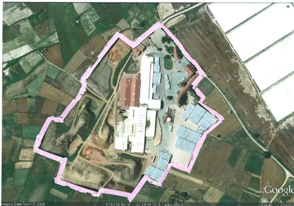
Слика 1. Мапа на локацијата со географска положба и јасно назначени граници на инсталацијата ВИНЕРБЕРГЕР ДООЕЛ Веница