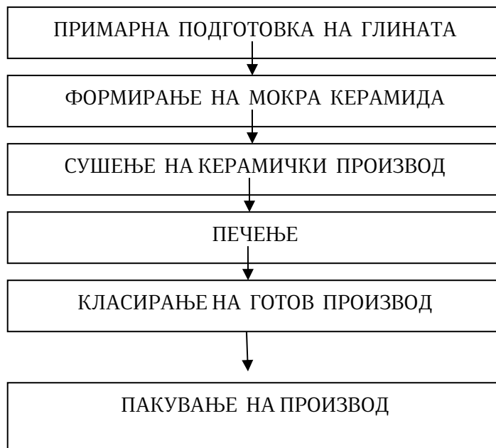
Слика бр. 2 Постапка за добивање керамички производ