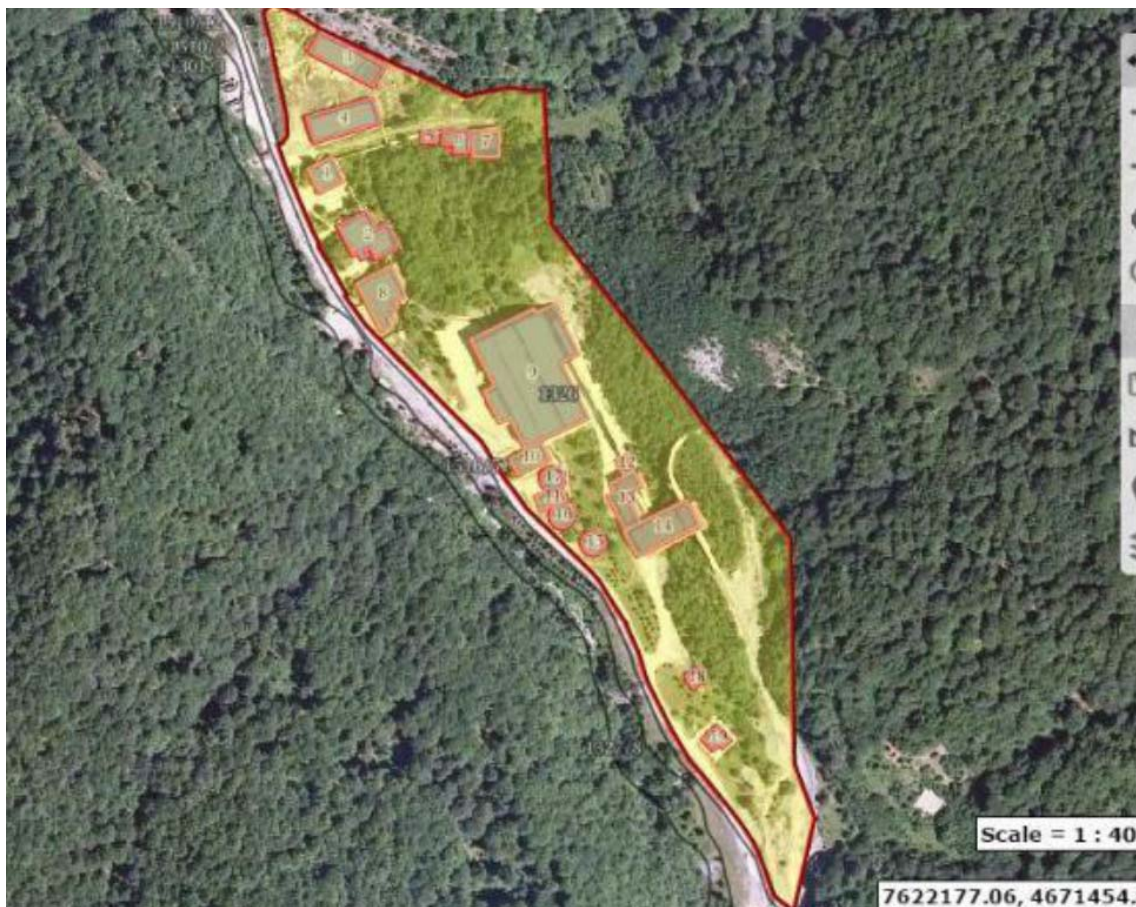
Слика 2 Граници на локацијата Флотација