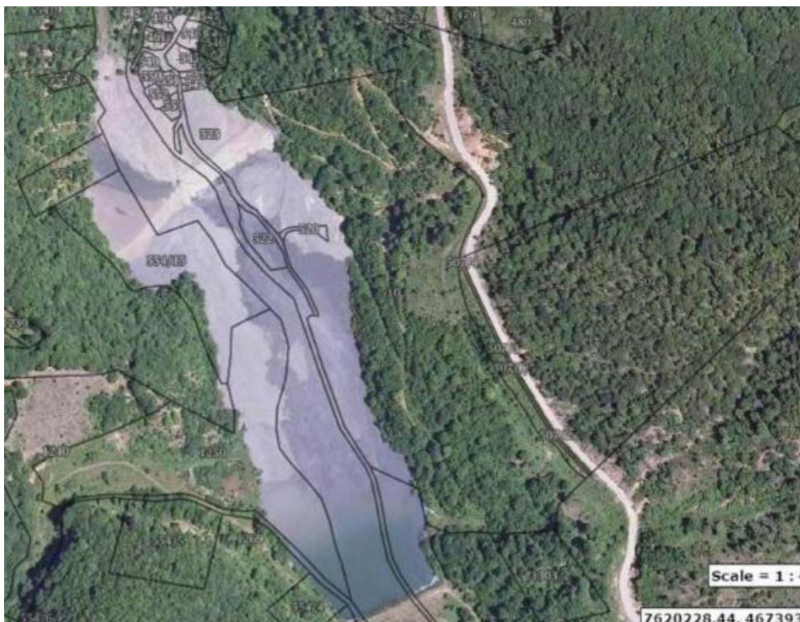
Слика 3 Локација на Хидројаловиште