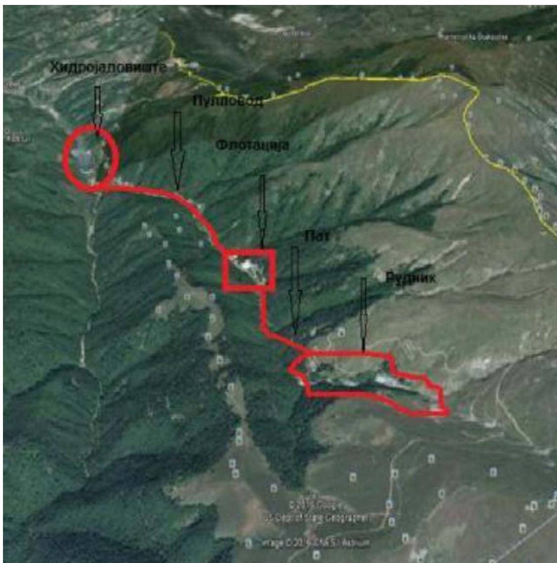
Слика 1 Поставеност на трите локации кои ја сочинуваат Инсталацијата (макро локација )