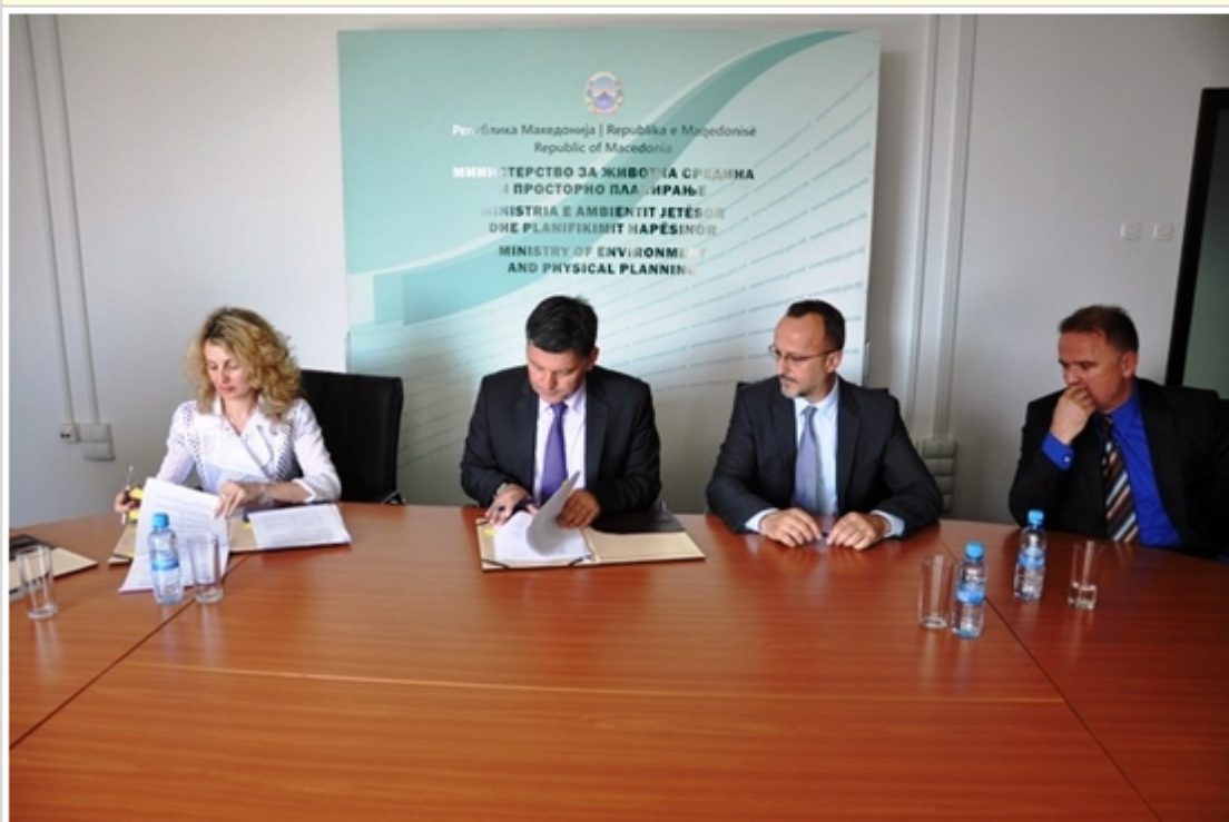
Ministri Izairi nënshkruan marrëveshje për nxitjen e studimeve arsimore me USHT-në dhe UEJL-në