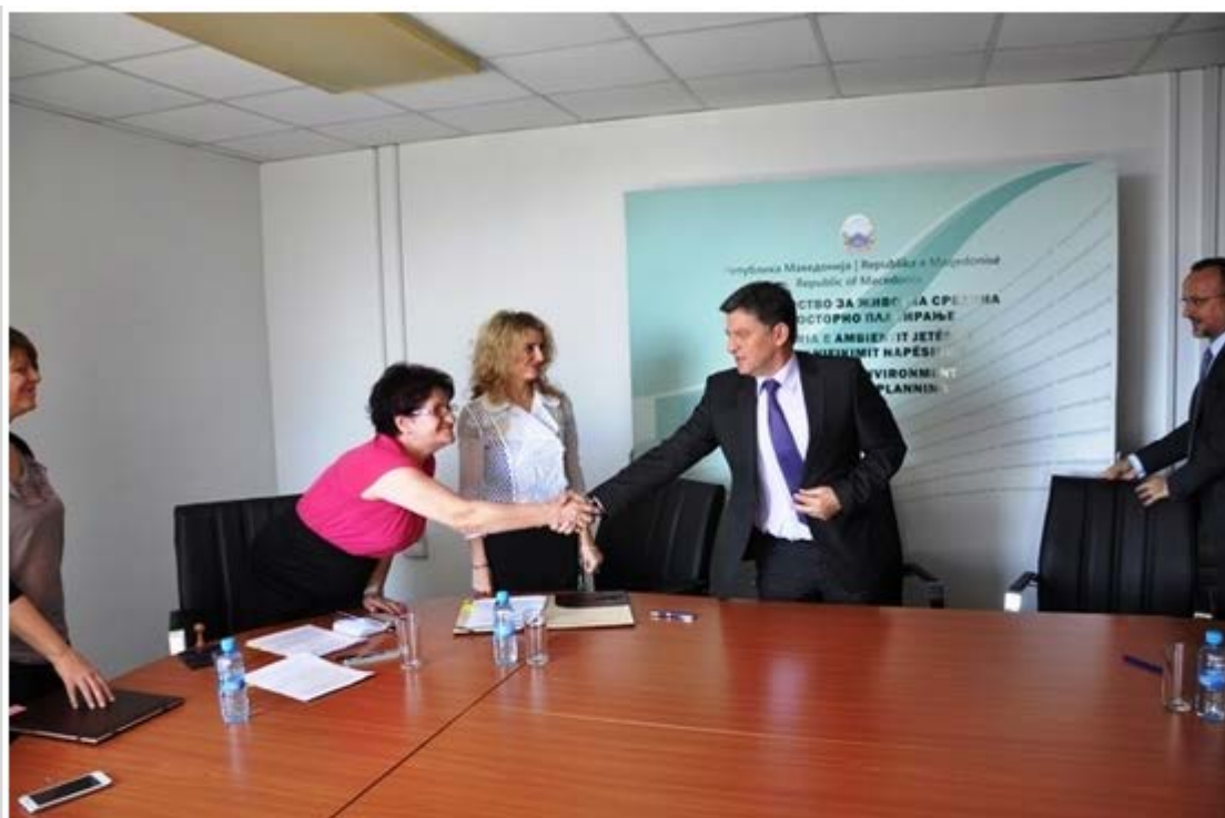
Ministri Izairi nënshkruan marrëveshje për nxitjen e studimeve arsimore me USHT-në dhe UEJL-në