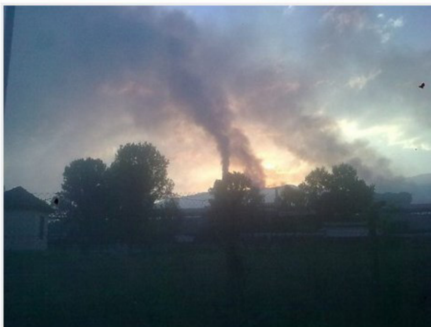
Fabrika - Jugohrom