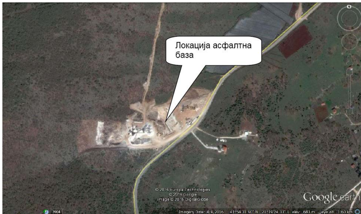
Слика 2. Мапа на локацијата со географска положба и јасно назначени граници на инсталацијата

1.1.3 Инсталацијата ќе работи, ќе се контролира, ќе одржува и емисиите ќе бидат такви како што е наведено во оваа Дозвола. Сите програми кои треба да се изготват според условите во оваа Дозвола стануваат дел од Дозволата.