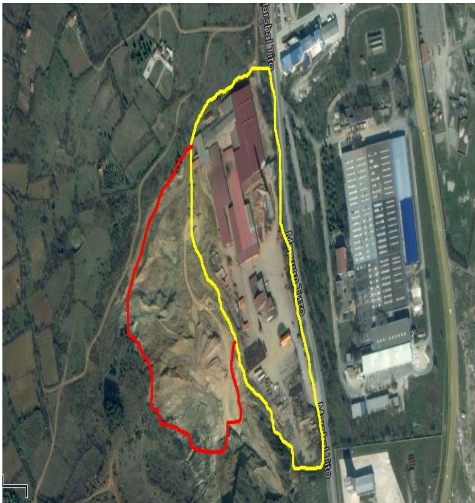
Слика 1. Мапа на локацијата со географска положба и јасно назначени граници на инсталацијата АД ИГМ “Еленица” - Струмица