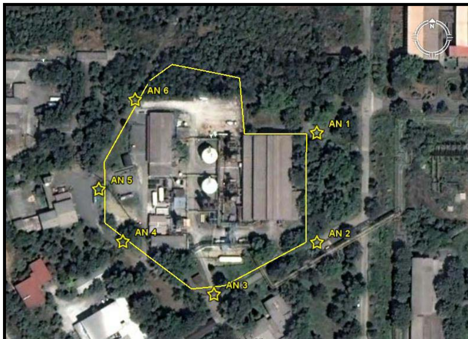
Места на мерење на амбиентална бучава