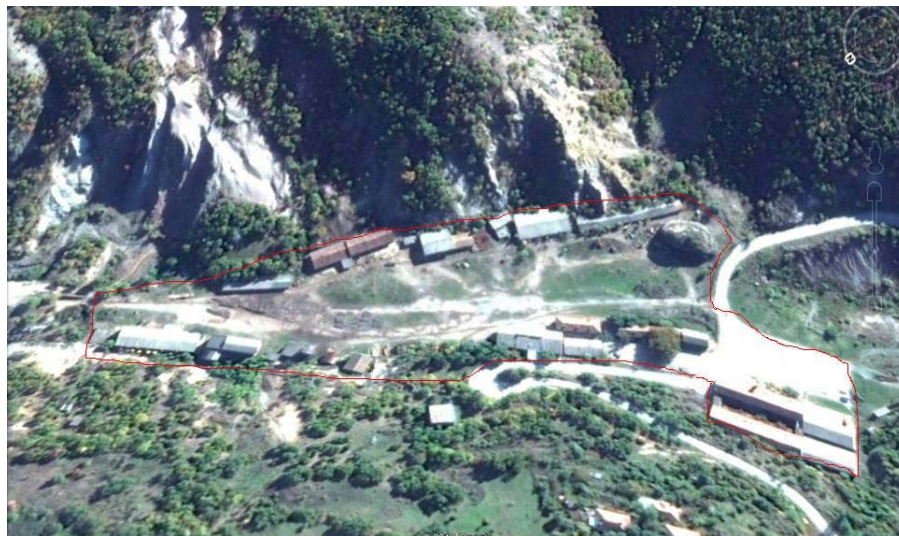
Слика 1. Мапа на локацијата со географска положба и јасно назначени граници на дел од инсталацијата ИММ Пробиштип, рудник Злетово – рудник Добрево