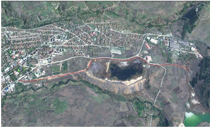
Слика 3. Мапа на локацијата на дел од инсталацијата ИММ Пробиштип, рудник Злетово – систем за транспорт на јаловина од погонот флотација до хидројаловиште Скрдово