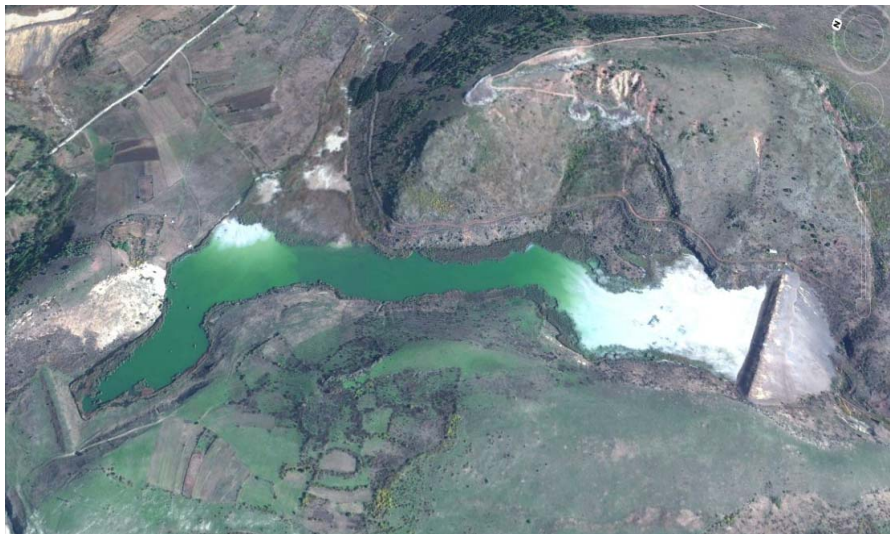
Слика 4. Мапа на локацијата на дел од инсталацијата ИММ Пробиштип, рудник Злетово – хидројаловиште Скрдово