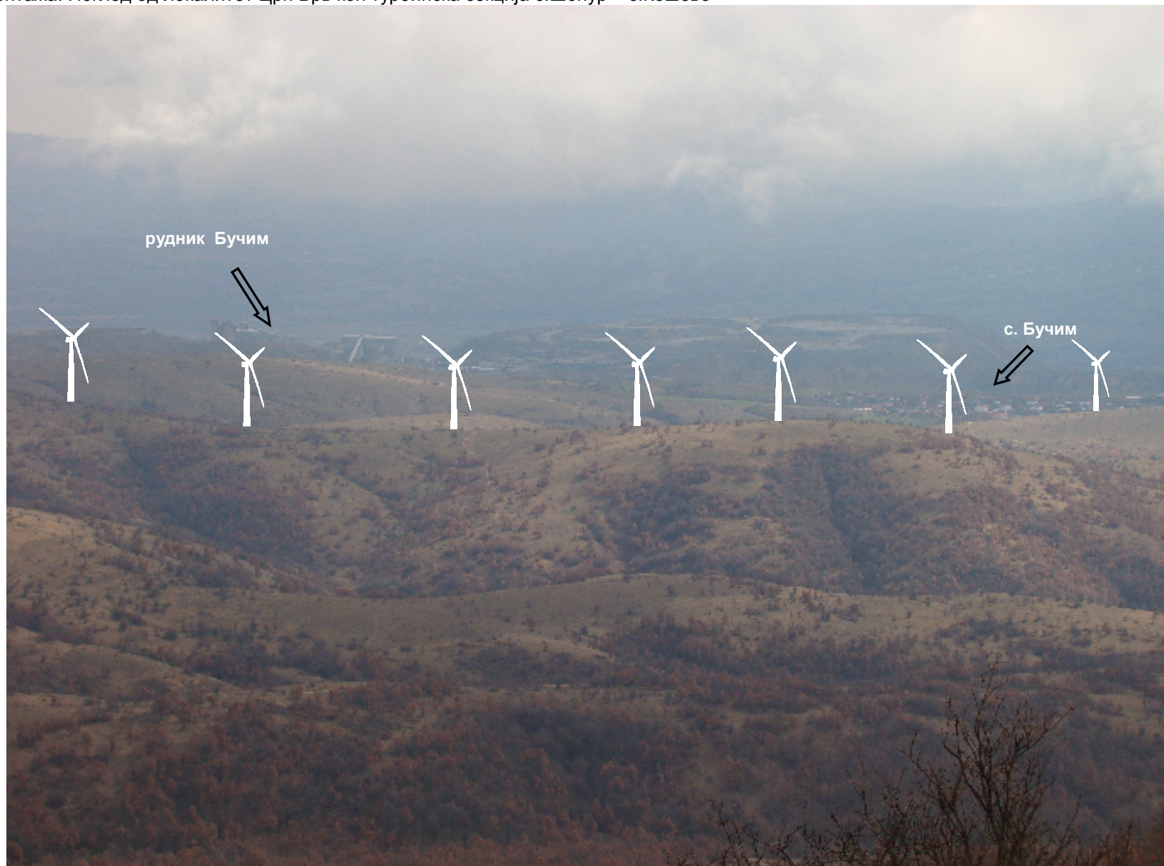
Монтажа: Поглед од локалитет Црн Врв кон турбинска секција с.Шопур – с.Кошево