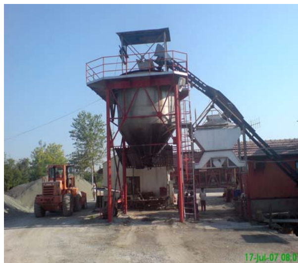
Silos za gotov asfalt