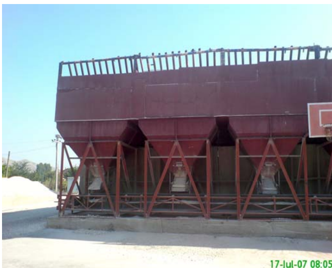
Boksovi za dozirawe