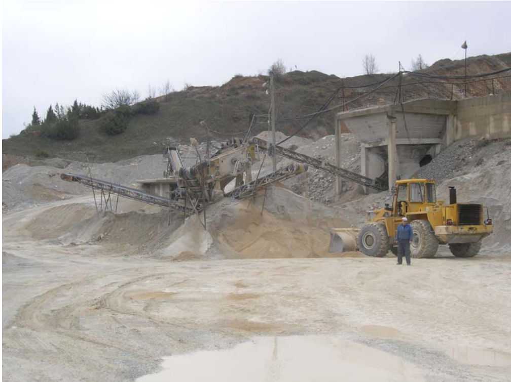
Сл.бр.2: Сепарација на минерална сировина во “Пелагонија” АД Гостивар

Припремата на варовникот во инсталацијата се врши по сува постапка на дробење и класирање. Во сепарацијата се поставени две челоусни дробилки кај кои горната граница на крупност (ГГК) на влезниот материјал може да биде до 300mm, односно 200mm. Едната дробилка е од типот BL-5 и е со капацитет Q = 35 - 40 (\text{m}^3/\text{h}) , а другата е од типот BL-3 со вкупен капацитет од 15- 20( \text{m}^3 / \text{h} ). Просејувањето на варовникот се врши преку систем од сита поврзани со додавачи кои го насочуваат сепарираниот варовник на гумени транспортни траки. Преку нив финалниот производ со соодветна гранулација за производство на бетон, асфалт или како тампонски материјал се транспортира на отворен склад.