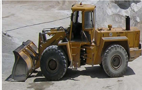
Слика бр.2 Булдожер

Поаѓајќи од проектираниот годишен капацитет на површинскиот коп, релативно големите експлоатациони резерви на секоја етажа овозможуваат добивањето на минералната сировина да се врши по завршената експлоатација на една етажа, односно доведување на истата во завршните граници по што се пристапува кон експлоатација на наредната етажа.