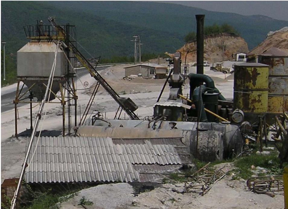
Сл.бр. 8 Асфалтна база “TELТОМАТ”- “Пелагонија” АД Гостивар