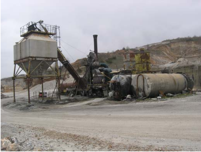
Сл.бр.6: Систем за зафаќање на гасови