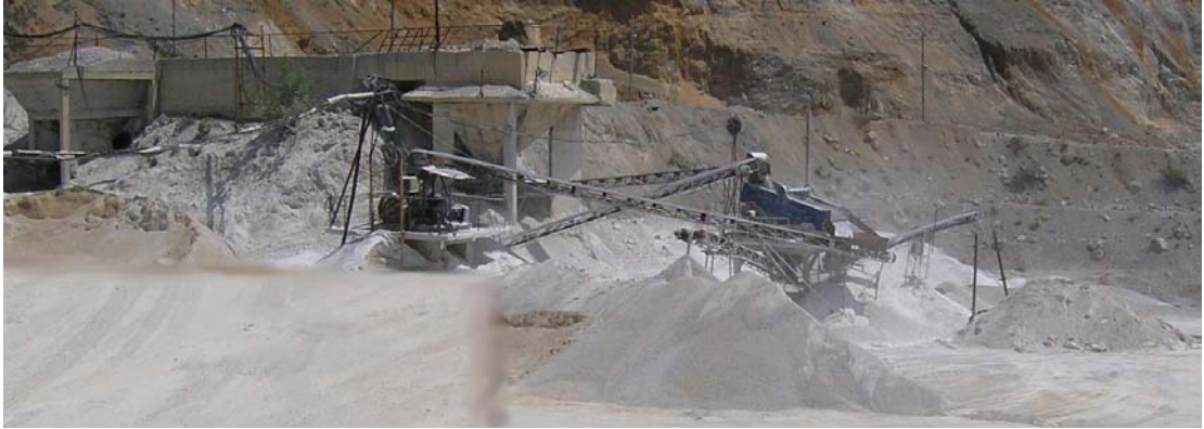
Слика бр.3: Дробилка со сепараторка тип VL-5

Под бункерот е поставен членкаст додавач кој го дозира материјалот преку гумена трака на вибрациона решетка и доколку материјалот има примеси на хумус и други нечистотии, тогаш истата служи како одвојувач на јаловина. Крупните парчиња на материјал од вибрационата решетка одат во челусна дробилка каде што се врши дробење на зрната. Со регулација на растојанието помеѓу ударните греди и плочите се регулира големината на излезното зрно. Контактните површини на граничните кај плочата се зајакнати, опремени со предодредена сопирна точка, заради заштита на дробилката од преоптоварување. Челустите се лиени од висок квалитетен мангански челик со назабување и можат да бидат завртени за 180 степени во случај на истрошеност. Издробениот материјал преку пресек на сипка паѓа на главниот излезен транспортер од каде со помош на ленти се носи на 3 степено вибрационо сито со димензии 1.070m x 3.200m кое овозможува сепарирање на три фракции кои со транспортни траки се движат во различни правци за создавање на куп од сепариран варовник со иста големина на каменот. Покрупните камења кои не поминале низ ниту едно сито преку повратна трака се носат во мобилна дробилка за ситнење односно добивање на тампон во фракции со големина на зрно од 0-30 mm, 0-60mm или 0-100mm или на повторно дробење во дробилките.