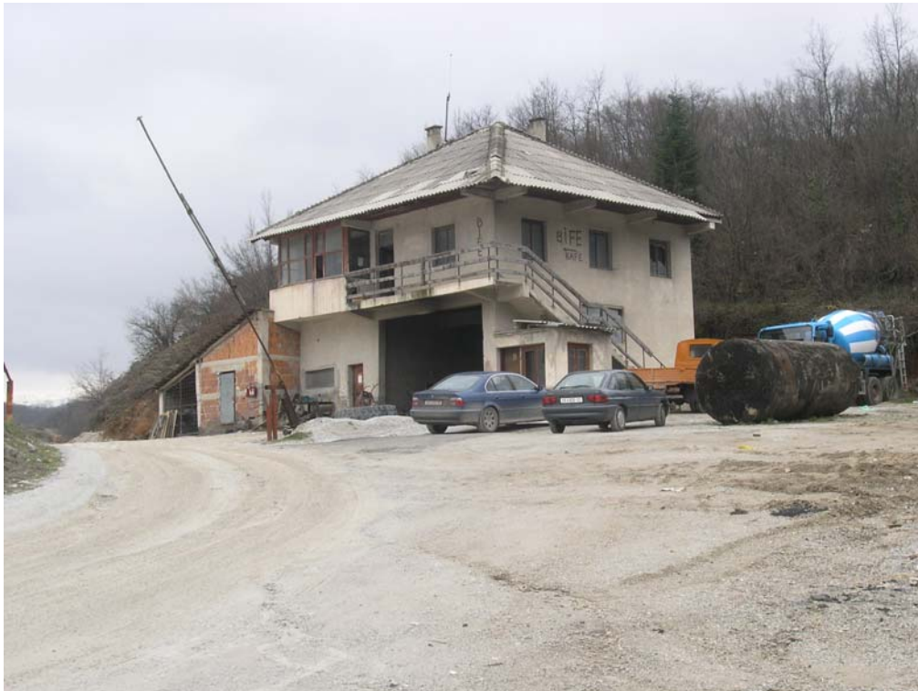
Сл.бр.4: Механичарска работилница и канцелариски простории во “Пелагонија” АД Гостивар

За помали поправки на возниот парк на инсталацијата и за чување на резервни делови за механизацијата се користи механичарската работилница и магацинските простории. Поголеме поправки и ремонти се изведуваат во механичарски сервис во Гостивар.