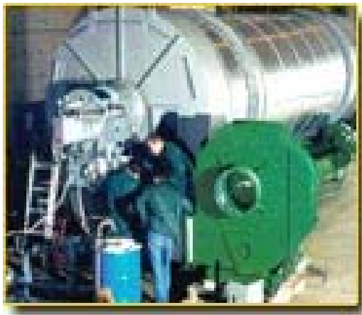
Сл бр.1:Инжињерскиот тим на Teltomat овозможува модернизација на базите

Претпријатието производител на асфалтната база Teltomat е основано во Берлин во 1906 година, а од 1994 година работи во состав на концернот "GP Günter Porenburg AG". Произведува современи асфалтни бази со капацитет од 60 - 320 t/час. Производите се стандардизирани според DIN ISO 9001/EN 29001, а производството на металните конструкции е во согласност со DIN 18800. Асфалтните бази на Teltomat се сретнуваат насекаде во светот како Албанија, Полска, Германија и.т.н. Тимот на Teltomat посебно внимание посветува на заштита на животната средина и на сите сопственици на асфалтни бази од нивното производство, независно од која генерација на производство припаѓаат овозможуваат зголемување на капацитетот на постројките и консултации во врска со целосна модернизација на базата.