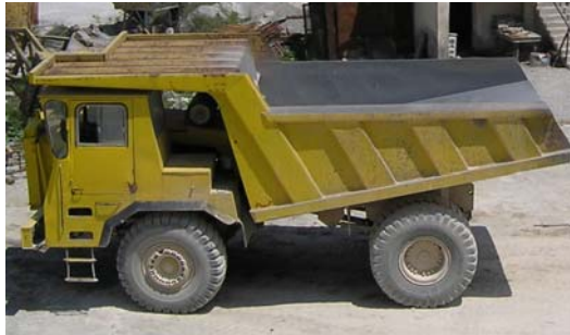
Слика бр. 1 Дампер