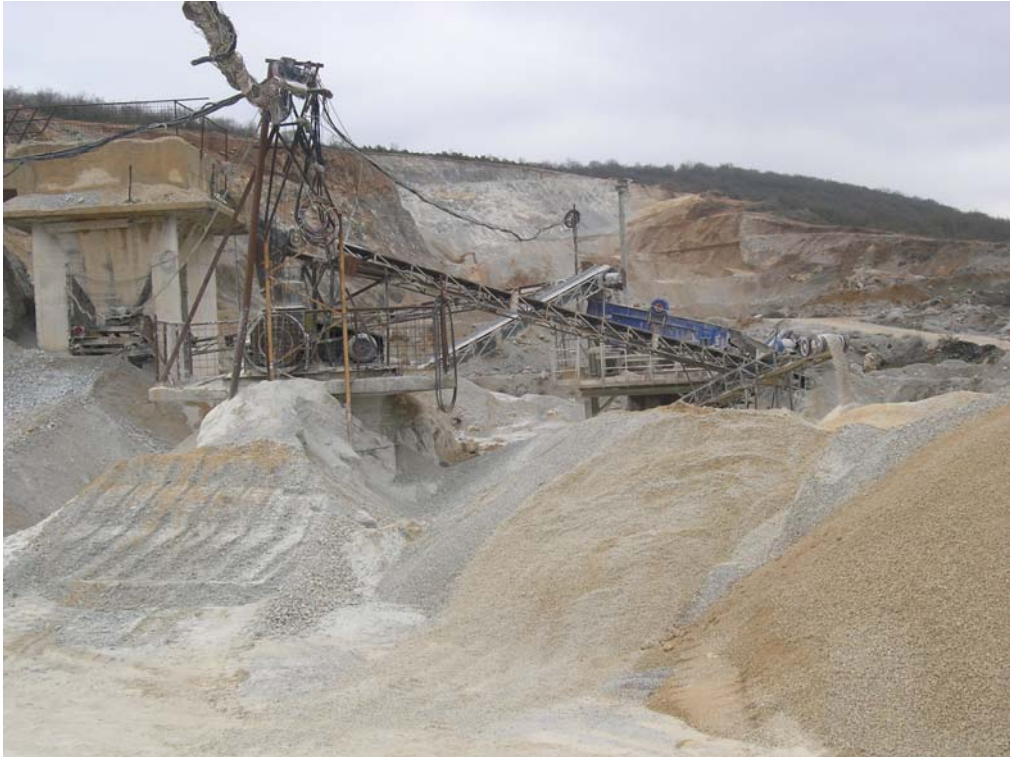
Сл.бр.5: Мешана бетонска фракција производ на “Пелагонија” АД Гостивар

За продажба најбарана е т.н. мешана бетонска фракција со големина на зрно од (0-14) mm за производство на бетонски блокови, фракцијата од (0-4)mm за малтерисување и меѓуфракциите за производство на асфалт.