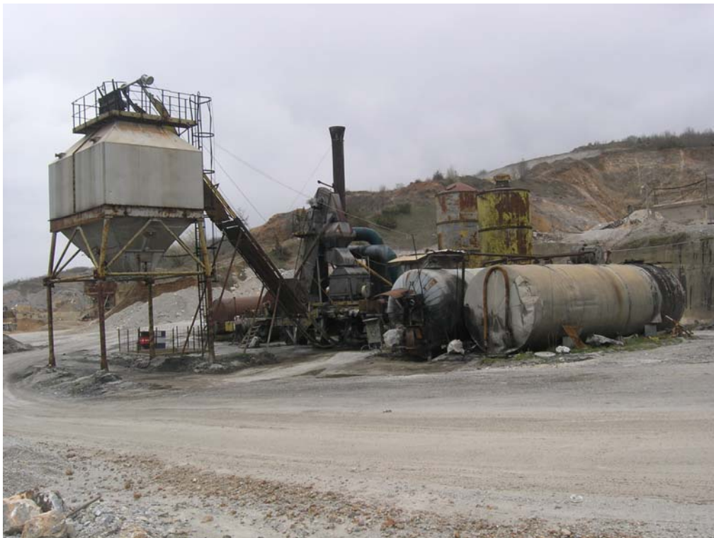
Сл.бр.3:Асфалтна база во “Пелагонија” АД Гостивар

Асфалтните бази може да бидат мобилни или стационарни во близина на поголемите градови и сообраќајници од повисок ред. Асфалтната база во инсталацијата зафаќа површина од 220m 2 и овозможува производство на асфалтна маса со капацитет од 30 - 40 (t/час). Асфалтната база е од Германско производство Teltomat.