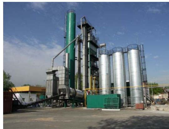
сл.бр.2: Асфалтна база на Teltomat во Москва

За асфалтната база Пелагонија Гостивар како НДТ треба да се инсталира вреќаст филтер кој ќе ја зафаќа прашината и преку цевковод ќе ја враќа назад во процесот.