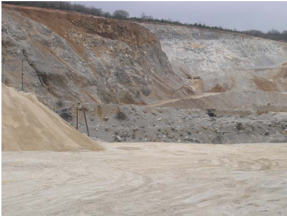
Сл.бр.1: Дел од површинскиот коп на “Пелагонија” АД Гостивар

На лежиштето “Краста” припаѓа на Западно македонската единица на карбонатно - филитичниот комплекс на планинскиот масив Буковиќ - Влаиница испитан е простор кој зафаќа површина од 2,8 km 2 . Во комплексот е оформен површински коп со планиран годишен капацитет од Q_{\text{god}} = 80.000(\text{m}^3 \text{ р.м/год.}) . Отпочната е експлоатацијата од кота на Е – 930 m од каде се врши минирањето на варовникот за потребите на производство на сепариран варовник, додека испитувањата на теренот направени се до највисоката кота со надморска висина од 970 m. Прилог 6 – Експлоатација на површински коп