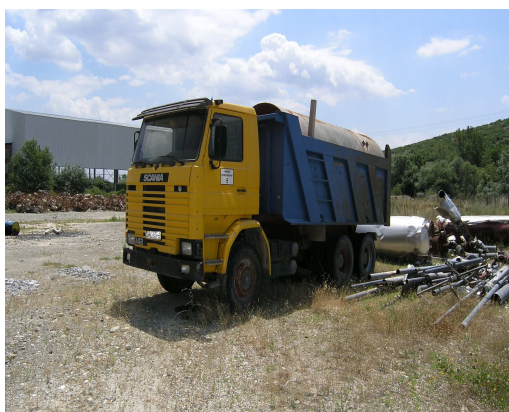
Сл 3. Цистерна

Товарна лопата со волумен на корпа од 2 м 3 и капацитет од 100м 3 /час, дизел вилушкар, цистерна за вода 20 т, четири камиони Volvo со носивост од 18 м 3 кои се набавени во 2009 год. Одржувањето на возилата и се врши во надворешни сервиси.