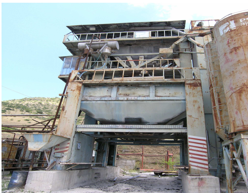
Слика 9. Складирање и товарење на асфалт

Како што е прикажано на слика 9 силосите за готов асфалт се наоѓаат на висина од околу 3,5 м заради можноста испод силосот да застане камион во кој се врши товарење. Дното на силосот е со хидрауличен отворач кој се отвора со притискање на копче кога камионот ќе биде во позиција под самиот силос. По исипување на асфалтот во камионот хидрауличната врата се затвора со што завршува циклусот на производство на асфалтот. Од командната кабина со рачна команда се управува со пневматскиот систем од постројка за производство на асфалт.