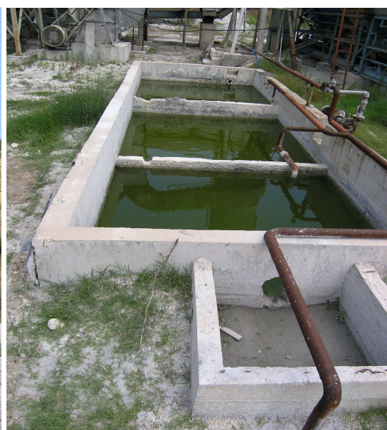
Сл. 10а. Трокоморен таложник

Прочистените гасови по поминување низ водена завеса преку оцак се испуштаат во атмосферата. Апсорбираните гасови и ситните микронски честички со водата се вливаат во трокоморен таложник прикажан на слика 10а.