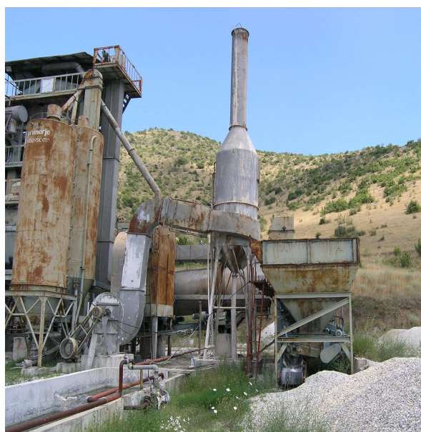
Сл. 10. Систем за прочистување

Камената прашина и испарувањата од мешаницата како и од сушарата и гасовите од согорување на мазутот (од бренирот) се зафаќаат водат во системот за прочистување кој се состои од циклон и воден филтер. Во циклонот се врши одстранување на крупните честички со паѓање на конусно дно. Честичките од конусното дно преку елеватор со кофички се упатуваат во силосите за филер. Гасовите се прочитуваат со поминување низ водениот филтер во кој се вградени прскалки со вкупно 18 дизни за распрснување на вода. На слика 10 прикажан е системот за прочистување.