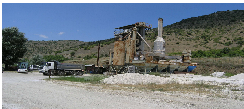
Слика 2. Асфалтна постројка

Асфалтната постројка од Италијанско производство тип S.I.M е прикажана на ситуацијоната карта дадена во прилог бр. 5 и сл. 2. На прилог бр. 2 е даден договор за закуп на постројката за производство на асфалт на неопределен рок. Произведена е во 1982 година и со моќност од 230 KW.