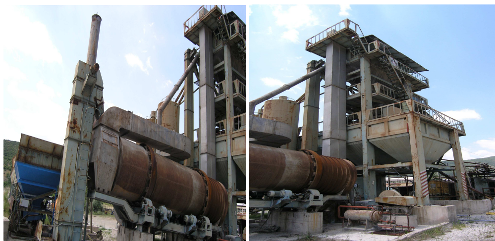
Сл.7.и 7а . Дел од постројката за асфалт со сушара

Од дозирните бункери прикажани на слика2. преку уреди за дозирање - вибродозерки минералниот агрегат во одредени количини паѓа на заедничка собирна транспортна трака. и се пренесува до вибрациониот додавач, низ кој во рамномерна количина се дозира, проаѓа, во ротациониот барабан од сушарата која е прикажана на сл. 7 и 7а.