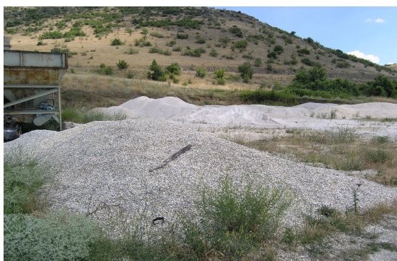
Сл.5 Отворен склад

Минералната, варовничка, суровина одложена на отворен склад (сл 5.) со лопатата од товарната машина, зависно од гранулацијата, се додава во еден од 5-те дозирни бункери за сепариран варовник. Сепарираниот варовник од 0-4 мм се складира во два бункери а додека сепарираниот варовник од 4-8 мм, 8-11 мм, 11-16 мм се складираат во останатите три дозирни бункери. Филер-микронизируваниот варовник се складира во два силоси од по 10 м 3 .