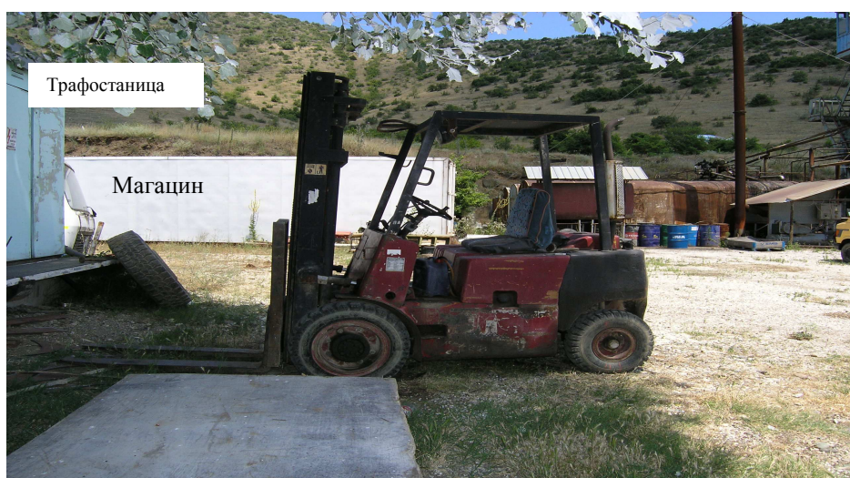
Сл.1 Дел од помошните објекти на асфалтната база

За потребите на петте вработени поставен е и полски тоалет кој се празни од страна на ЈКП СЦГ. Широкото дворно место се користи за складирање на минералната суровина, паркирање и движење на транспортни возила. (камиони), лесни возила и останатата механизација. Манипулативните површини и пристапниот пат овозможуваат лесен пристап и движење на возилата.