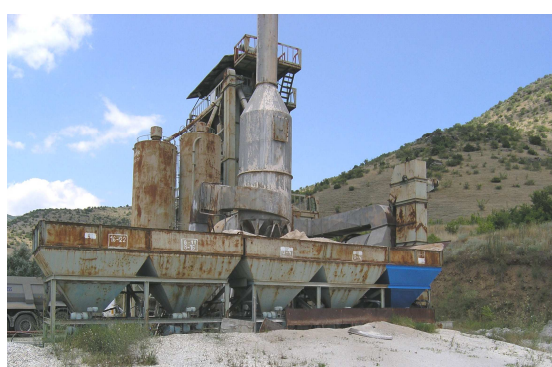
Сл.6 Бункери за минерална суровина

Од дозирните бункери прикажани на слика2. преку уреди за дозирање - вибродозерки минералниот агрегат во одредени количини паѓа на заедничка собирна транспортна трака. и се пренесува до вибрациониот додавач, низ кој во рамномерна количина се дозира, проаѓа, во ротациониот барабан од сушарата која е прикажана на сл. 7 и 7а.